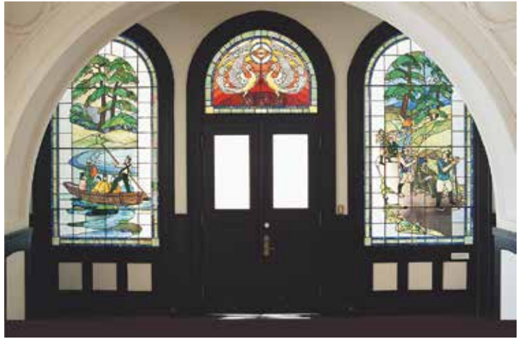
2 층 대홀 스테인드글라스(오월동주/봉황/하코네고에)

또한 이곳은 요코하마 시정을 맡았던 요코하마 마치카이쇼의 터, 요코하마 상공회의소의 발상지, 메이지 시대의 미술가 오카쿠라 텐신이 태어난 곳으로, 각각 기념비가 세워져 있습니다.